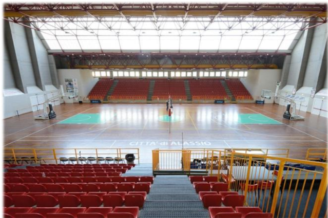
PALALASSIO - PALAZZETTO DELLO SPORT RAVIZZA

VIGE IL REGOLAMENTO FIBUR TORNEO RISERVATO AI TESSERATI FIBUR