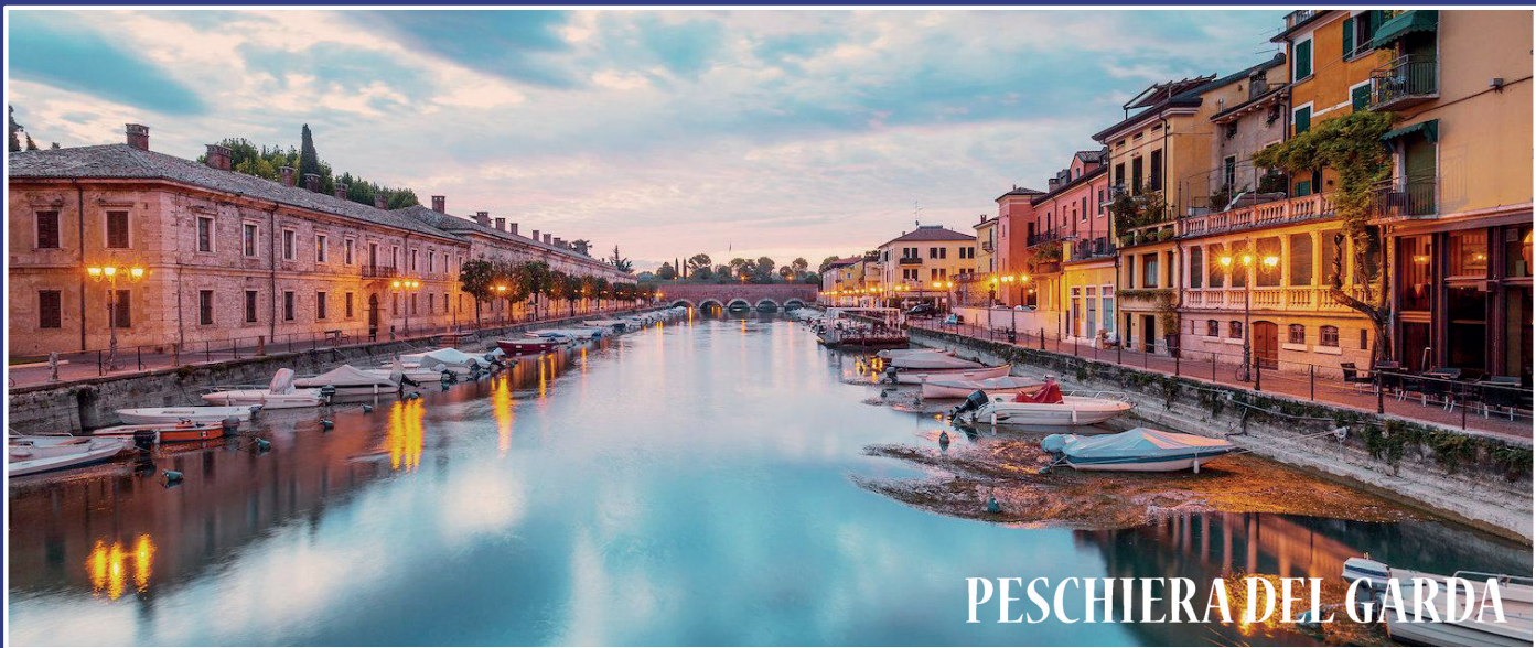
PESCHIERA DEL GARDA