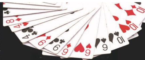
grafico e stampa: www.proliferazioni.com