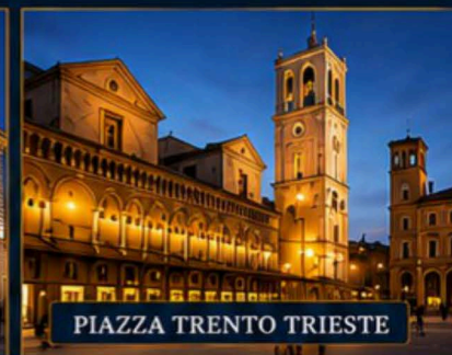
PIAZZA TRENTO TRIESTE

Programma completo e dettagli nella SECONDA PAGINA