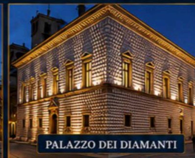
PALAZZO DEI DIAMANTI