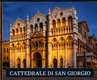
CATTEDRALE DI SAN GIORGIO