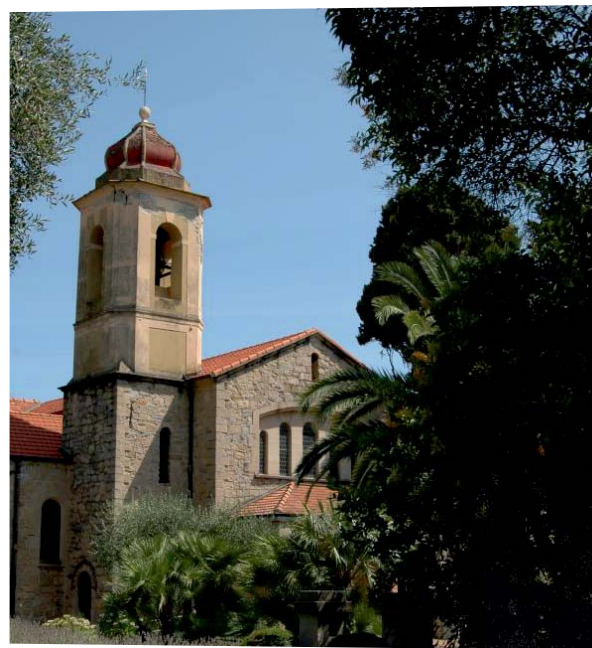
Bordighera -ex Chiesa Anglicana