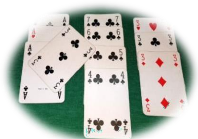
Carta valida da accorparsi al gioco naturale