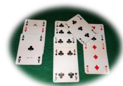
Palese dubbio: se non dichiarata, decide il primo avversario di turno

considerate valide, ma congeleranno temporaneamente il gioco; se invece toccano due giochi o non toccano nessun gioco e creano palese dubbio, sarà l'avversario di turno a decidere la loro collocazione; se cadono su un gioco che non le può contenere saranno considerate penalizzate (art. 24) e scartate secondo norma.