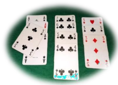
Carta errata: da scartare

Se il lancio del nuovo gioco o quello delle carte legate costituiscono l'ultimo gioco effettuato prima della chiusura, questa è valida e l'arbitro ammonirà la coppia colpevole.