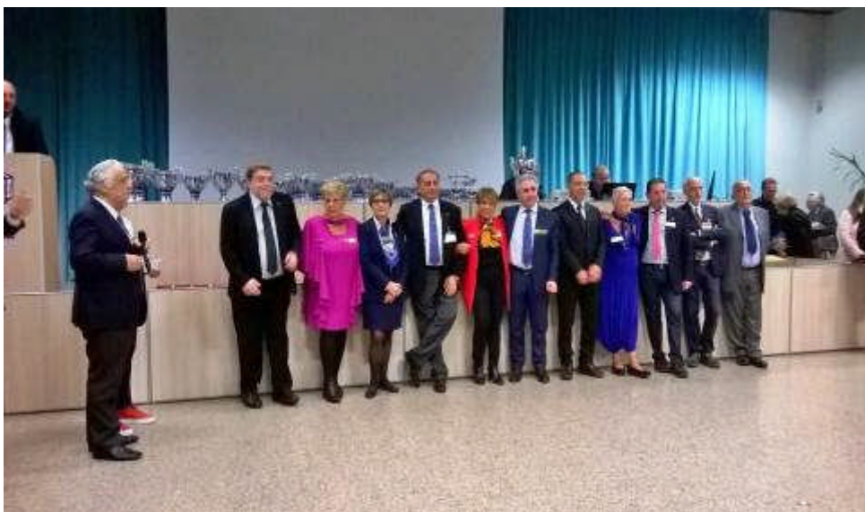
Gli arbitri dei Campionati