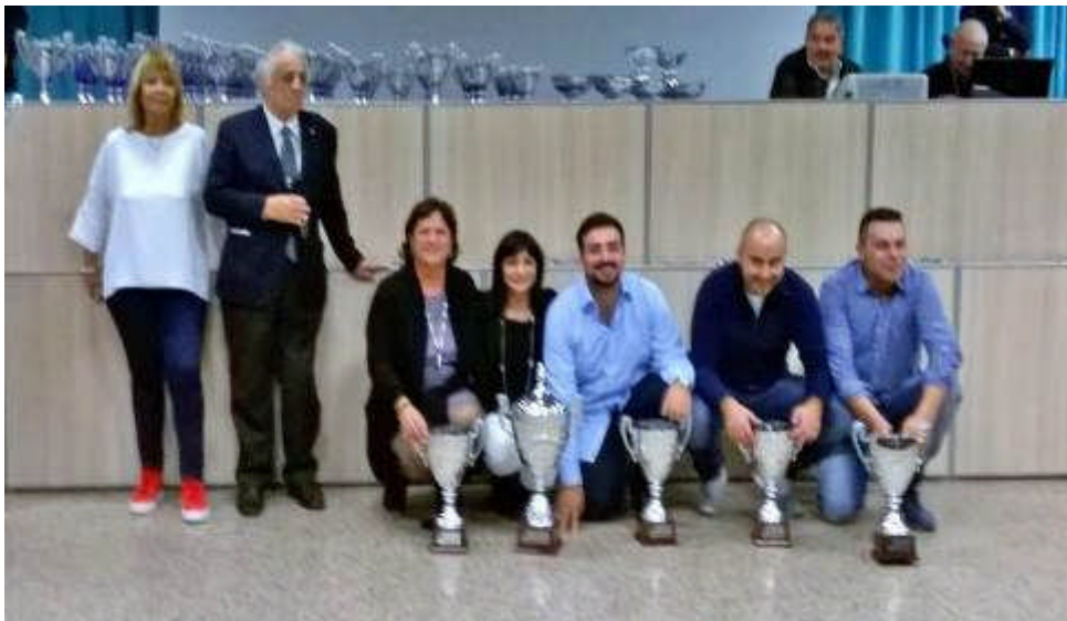
I Campioni d'Italia 2016

Sedi di gara Palazzo del Turismo e Hotel Mediterraneo Riccione