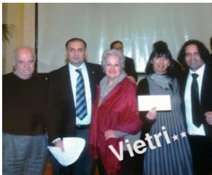
Premiati a Vietri