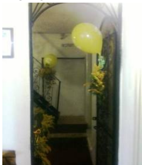
Ingresso della sede

In occasione della inaugurazione ufficiale, il 22 settembre, interviene persino la TV locale TRS per riprendere l'evento.